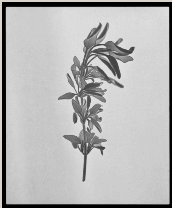
Saint-Pierreville - Eric Dessert, 2021 Négatif rétroéclairé - 10 x 12,5 cm

Trois résidences à la Fabrique du pont d'Aleyrac, en Ardèche