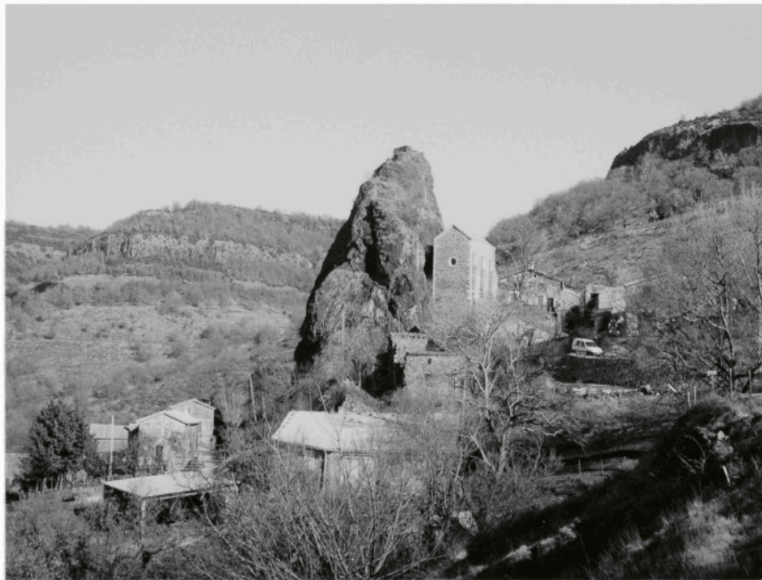
Saint-Pons, Ardèche , 2010 - Bernard Plossu Tirage argentique - 8 x 12 cm