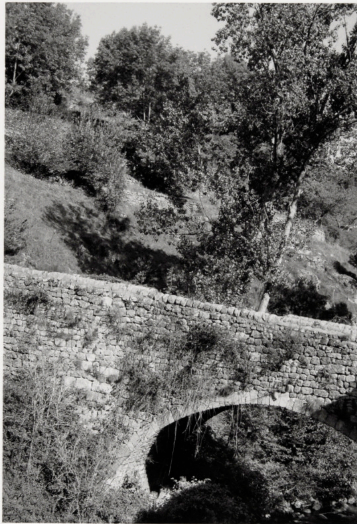
Le pont d'Aleyrac, Ardèche, 2009 - Bernard Plossu Tirage argentique - 8 x 12 cm

« On rencontre quelquefois dans la vie ces amitiés profondes avec un lieu, des gens... lorsqu'Annie et Bernard, de la Fabrique, m'ont proposé de travailler sur l'Ardèche, j'ai retrouvé ici un esprit qui me parlait aussi de ma vie au Nouveau-Mexique, de ce que nous cherchions dans ces années de bohème et d'utopie... »