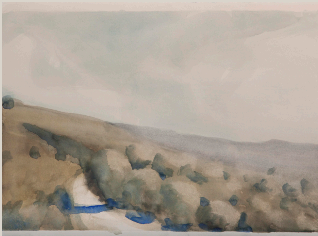
Paysage n°36, Ardèche - Marcelo Fuentes Aquarelle - 25,5 x 35 cm

Les œuvres de Marcelo Fuentes, bien que fidèles au motif, semblent prendre naissance dans l'imaginaire et le rêve et dégagent une atmosphère contemplative et mystérieuse qui n'appartient qu'à elles.