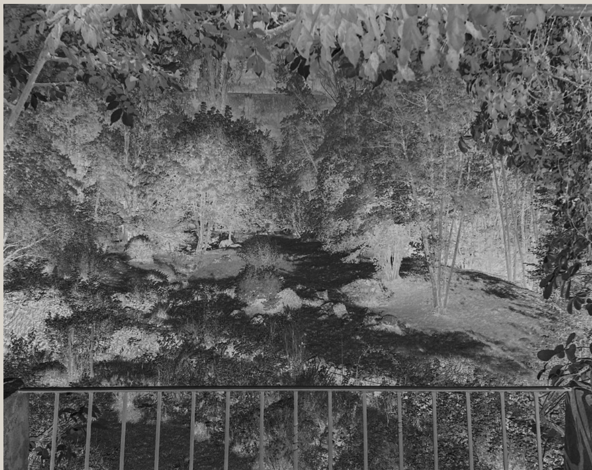
Saint-Pierreville - Eric Dessert, 2021 Négatif rétroéclairé - 10 x 12,5 cm

Les cadres comportant un rétro-éclairage, patiemment mis au point et assemblés par Eric Dessert complètent et achèvent ce processus de création.