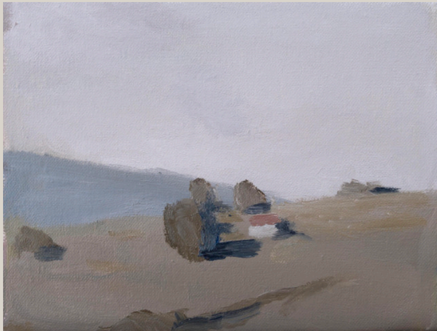
Paysage n°112, Ardèche - Marcelo Fuentes Huile - 15 x 20 cm