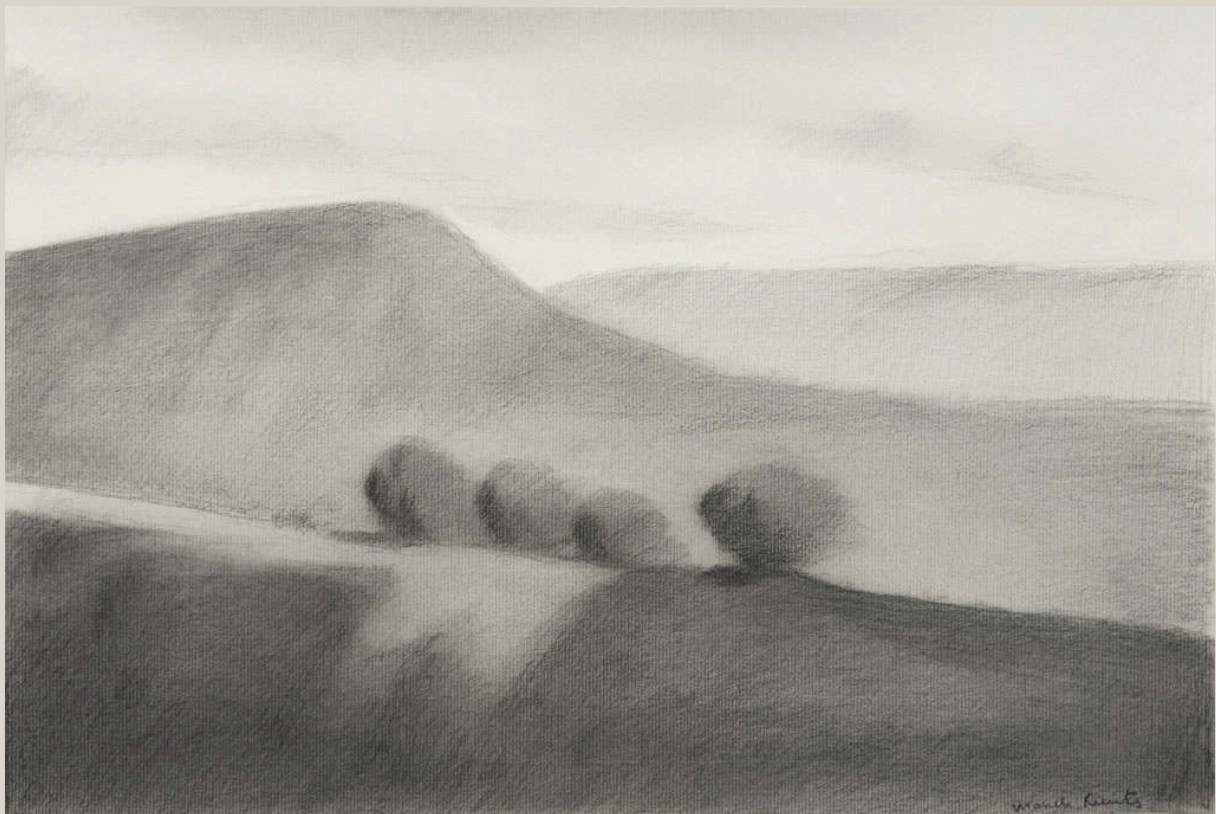
Ardèche, 2012 - Marcelo Fuentes Fusain - 33 x 50 cm