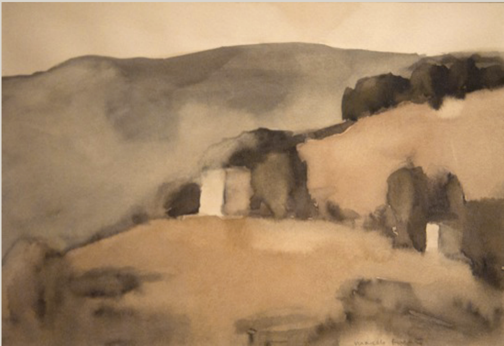
Ardèche - Marcelo Fuentes, 2012 Aquarelle - 17 x 27 cm