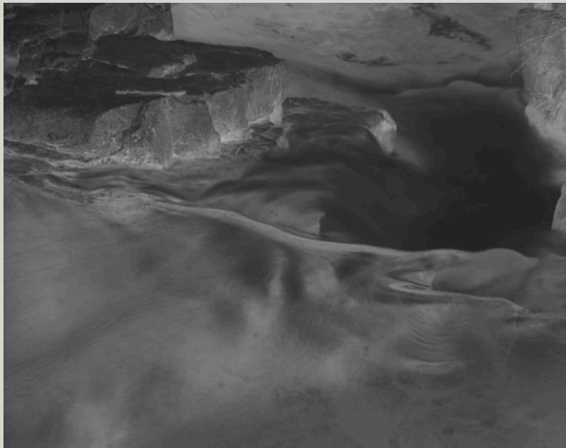
Saint-Pierreville - Eric Dessert, 2021 Négatifs rétroéclairés - 10 x 12,5 cm